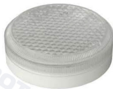
Исполнение 3, диаметр 180мм

ЛУЧ-12-С 34/64, ЛУЧ-24-С 34/64, ЛУЧ-36-С 64, ЛУЧ-220-С 34/64, =12/=24/~36/~220В, 3/6Вт, 460/800Лм, 4000К (3000/5700К под заказ)