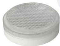
Исполнение 4, диаметр 150мм

ЛУЧ-12-С 34/64, ЛУЧ-24-С 34/64, ЛУЧ-36-С 64, ЛУЧ-220-С 34/64, =12/=24/~36/~220В, 3/6Вт, 460/800Лм, 4000К (3000/5700К под заказ)